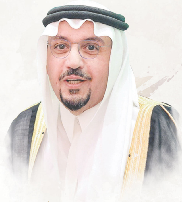
صاحب السمو الملكي الأمير الدكتور فيصل بن مشعل بن سعود بن عبدالعزيز آل سعود أمير منطقة القصيم