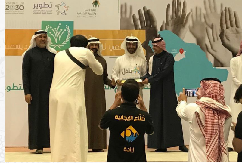
أثناء تكريم الجمعية